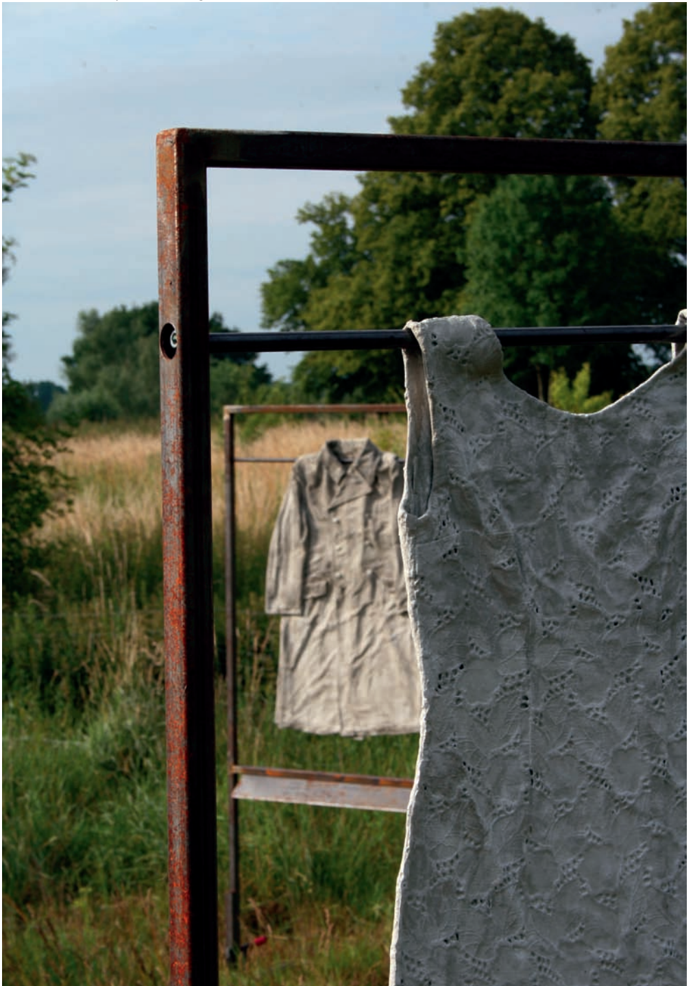
Renate U. Schürmeyer Erstarrung , 2009.